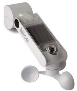
Automatisme NiceScreen vent/soleil à cellules photovoltaïques