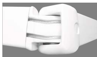
Tension des bras par double câble gainés pour les stores

Pour les versions motorisées, les moteurs et l'ensemble des automatismes sont garantis 2 ans.