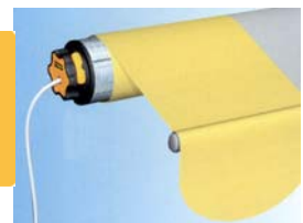
DIRECT-STORES DISTRIBUTION - Février 2020

Direct-Stores garantit ses stores de terrasse 5 ans contre tous vices de fabrication. Cette garantie couvre l'armature et la toile.