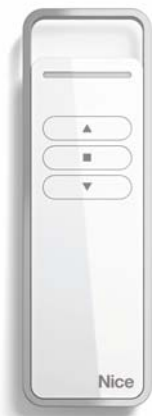
Télécommande NiceScreen Era-P1