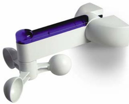
Automatisme NiceScreen vent/soleil