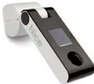
Automatisme NiceScreen soleil/pluie